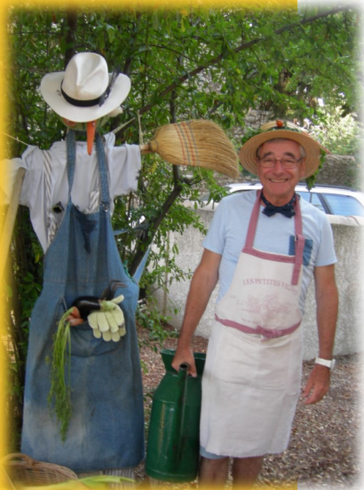
à Parpaillots en fête, juillet 2019

C'est dans la mesure où je cesse de la chercher dans mes œuvres que l'authenticité m'est donnée, dans la foi de Christ. Je ne peux la mesurer au miroir de critères moraux. Simplement y croire, et alors... quelle joie !