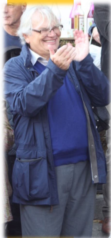
Les encouragements du président

Enfin vivre avec tous la liberté, la confiance, la fraternité et l'amour du prochain auxquels la foi chrétienne nous appelle, n'est-ce pas ce qu'on essaie de faire au quotidien dans notre propre famille ? L'église n'est-elle pas une grande famille ?